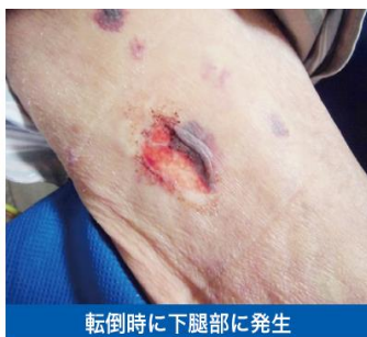
転倒時に下腿部に発生

スキナーテアとは、 摩擦やずれによって皮膚が裂けて生じる真皮深層までの損傷 のことです。