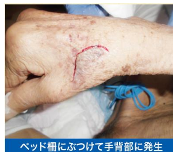
ベッド柵にぶつけて手背部に発生