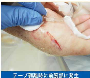
テープ剥離時に前腕部に発生